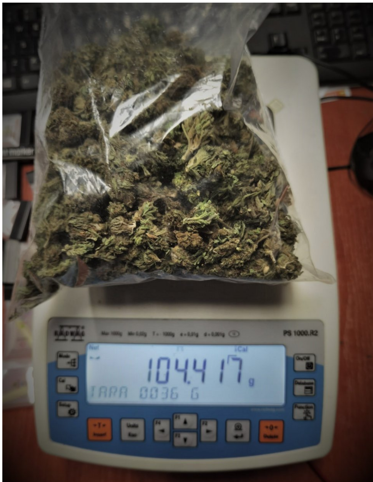
foto: część przejętej przez policjantów marihuany

Obecnie policjanci dalej wyjaśniają szczegółowo wszystkie okoliczności tej sprawy. Sprawdzają m.in. źródło pochodzenia zabezpieczonych środków oraz to, jakie było dalsze przeznaczenie zabezpieczonych narkotyków.